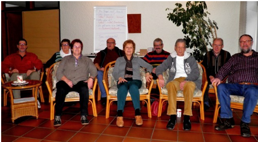
Gruppenbild "Spirituelles " Wochenendseminar in Baasem Dezember 2014

Schon jetzt sei auf das nächste „Spirituelle Wochenende“ im Dezember 2015 hingewiesen.