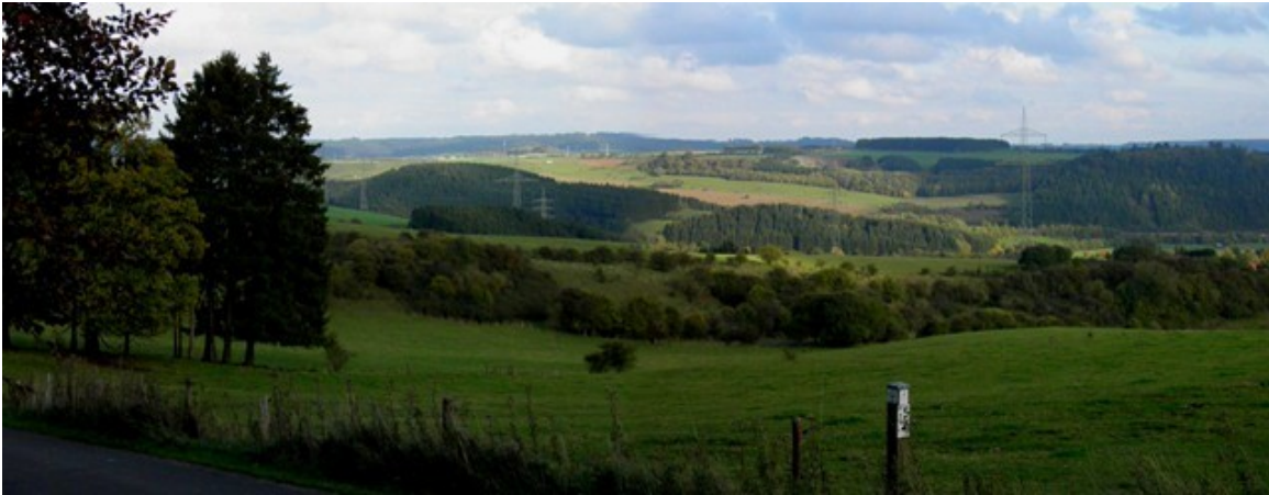
Blick vom Seminarhaus ins Tal

Es zeigt, wie sehr der Glaube mitten im Leben uns helfen kann, Wege zu finden, das Leben als sinnvoll, also „voll des Sinnes“ anzunehmen Neben den intensiven Gesprächen kam natürlich auch die Gemeinschaft nicht zu kurz, ein Grillabend (im Winter!!), Spaziergänge in der schönen Eifelandschaft